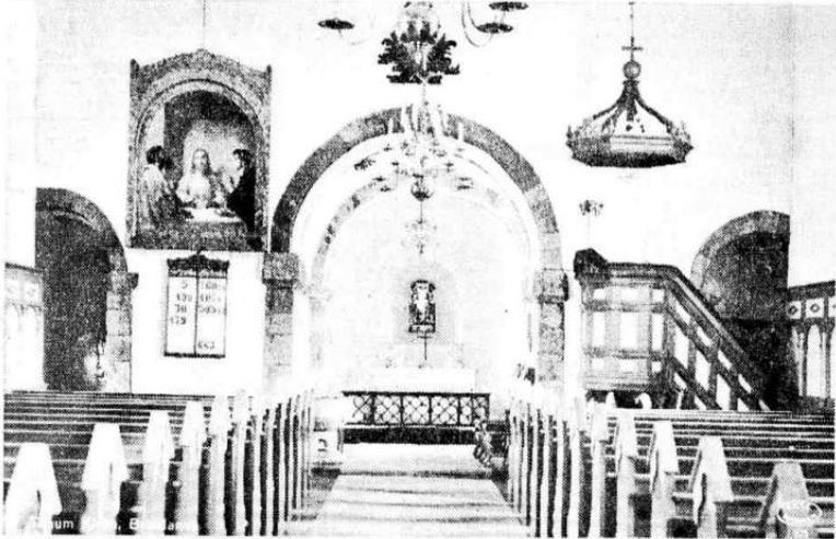
Tanum kirke i Brunelans ble bygget under Sigurd I Magnusson Jorsalfare (død 1130). Kirken er kjent også for sitt gamle inventar, bl.a. en middelalderes døpefont med dyrelieffer, og nu har restaurering og røntgen/fotografering gitt oss ny viden om altertavels historie.